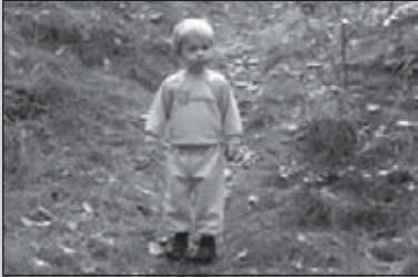
Ons jongste lid

CLUBBLAD VAN WSV OLAT • JAARGANG 36 • NUMMER 2 • FEBRUARI 2010