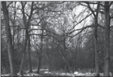
Pijlen weg, wat nu?