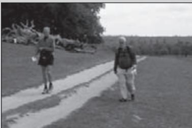
Capital Ring Walk om Londen