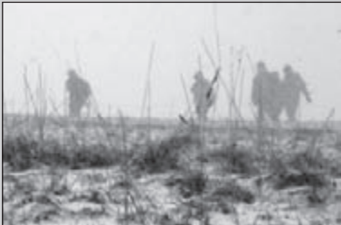
Witte kerst in Banneux